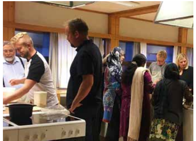
Matlagingskursene på Mortensrud skole er populære.

– Vi prøver hele tiden å fokusere på hvordan vi kan være med å gjøre denne bydelen enda bedre å bo i. Vi vil være med å skape en god atmosfære for å hjelpe hverandre.