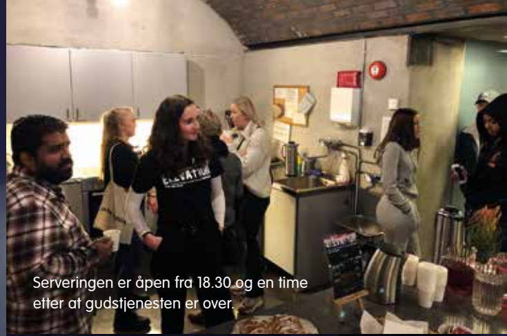
Serveringen er åpen fra 18.30 og en time etter at gudstjenesten er over.