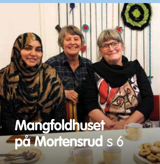
Mangfoldhuset på Mortensrud s 6