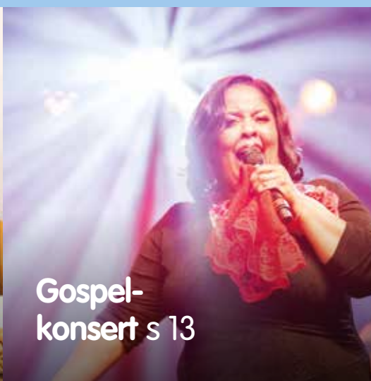
Gospel- konsert s 13