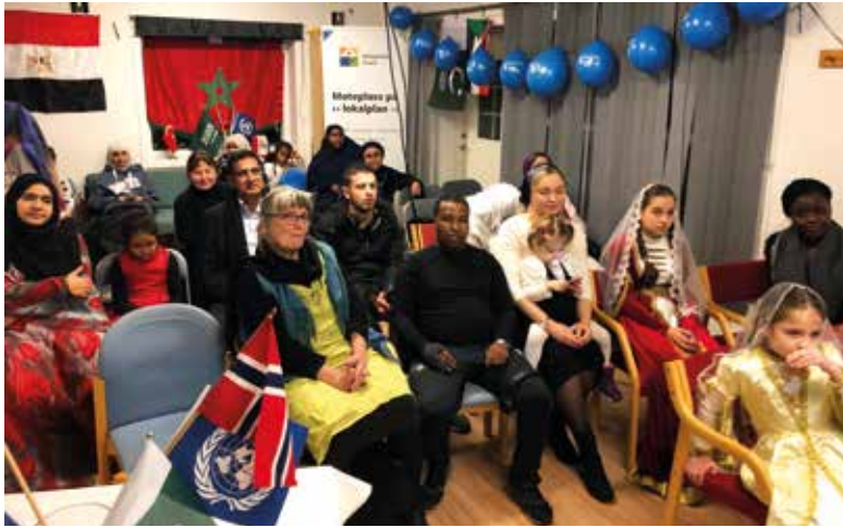
Folk med bakgrunn fra 11 land var til stede da FN-dagen ble markert på Mangfoldshuset i oktober.