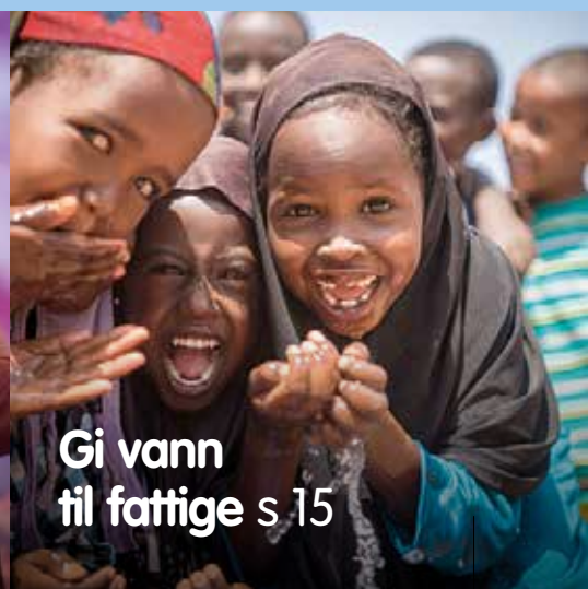
Gi vann til fattige s 15